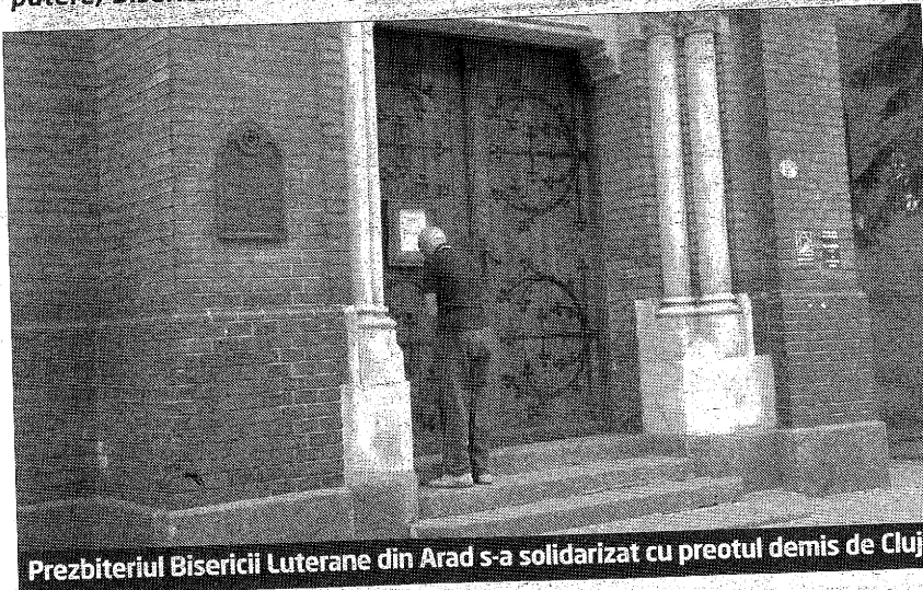
Prezbiteriul Bisericii Luterane din Arad s-a solidarizat cu preotul demis de Cluj

toată puterea a fost concentrată în jurul episcopului. Între Parohie și Episcopie au început apoi să apară tot felul de probleme, pastorul acuzând conducerea centrală a Bisericii că nu a primit niciun răspuns ori de câte ori solicita o adeverință sau să se organizeze exa-